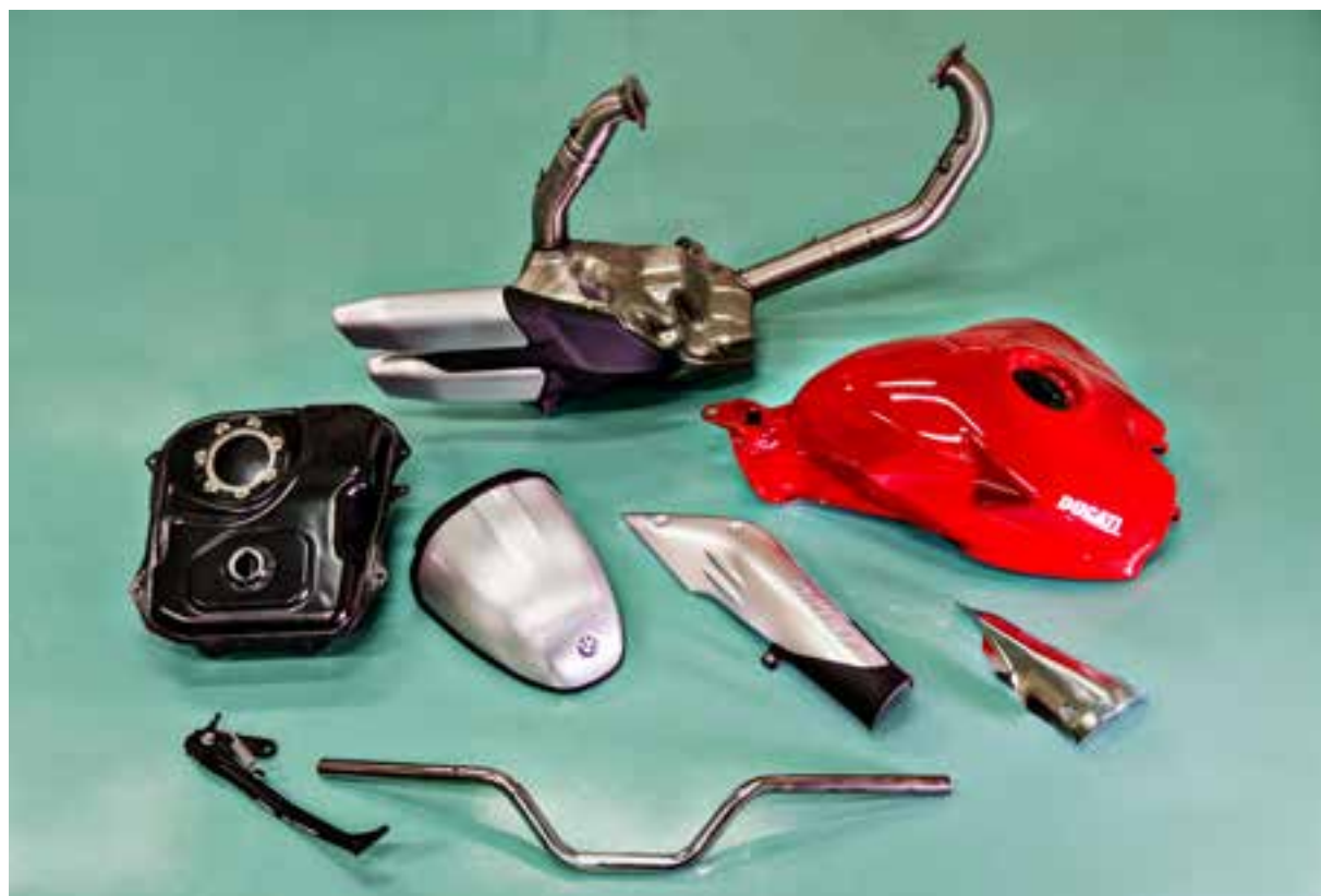
SOPRA: ALCUNI COMPONENTI REALIZZATI DA LA TECNOMECCANICA SUD

naccio - Infatti sul nostro territorio, e nell'intero Abruzzo, non esistevano aziende che potessero assorbire il lavoro di attrezzeria, tranne l'azienda per la quale lavoravamo come dipendenti. Proprio questa azienda è diventata successivamente il nostro primo cliente. Fortunatamente sul nostro territorio, nel tempo, sono arrivati insediamenti industriali di brand prestigiosi